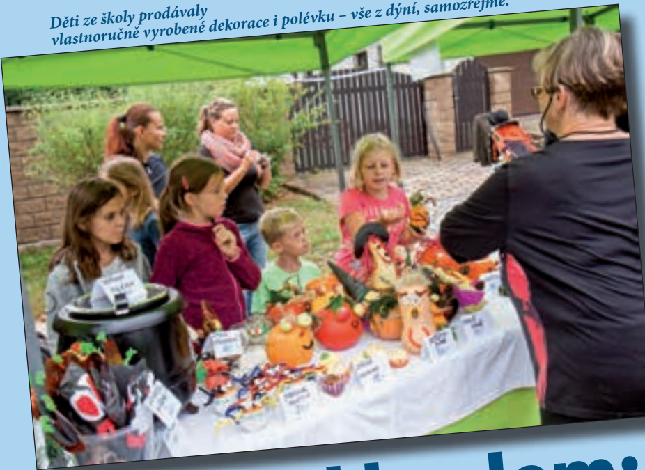
Děti ze školy prodávaly vlastnoručně vyrobené dekorace i polévku – vše z dýně, samozřejmě.