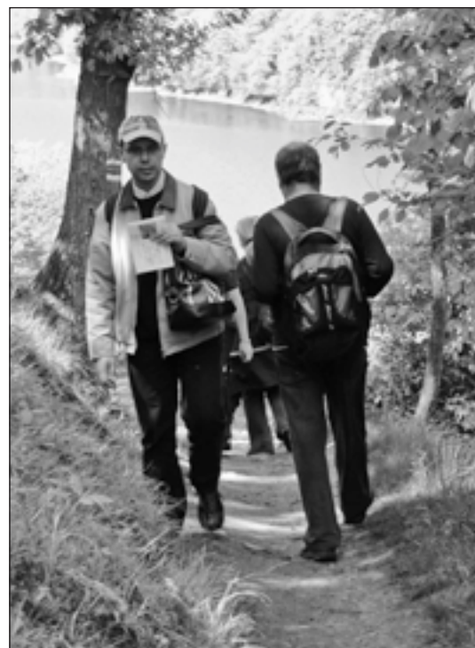
S Vltavou po levém boku, jednou kousek od břehu, jindy pár metrů nad hladinou, se vine stezka začínající ve Štěchovicích místy stoupající, pak zase klesající až téměř k řece. I v největším vedru je tu příjemný chládek.

Opustil jsem Ztracenku a stále dosti kamenitou cestou, vinoucí se jen pár metrů od hladiny řeky, se blížil k osadě, která nese název Svatojanské proudy. To je to místo,