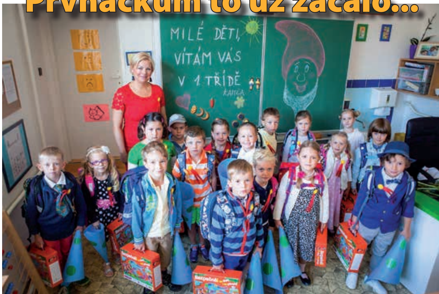
Zahájení nového školního roku v líšnické škole.