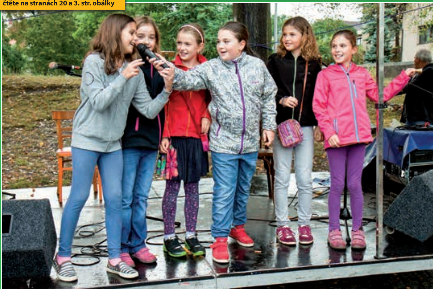
Líšnický festival: I letos si naši malí zpěváci a zpěvačky vyzkoušeli zpěv na pódiu