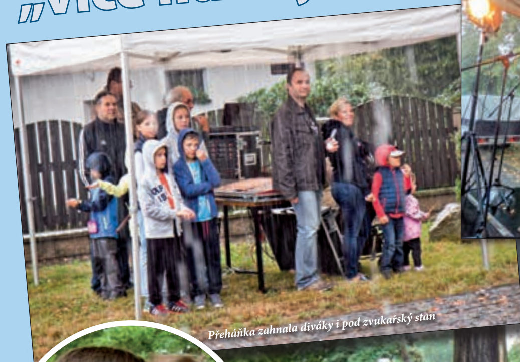
Přeháňka zahнала diváky i pod zvukařský stan