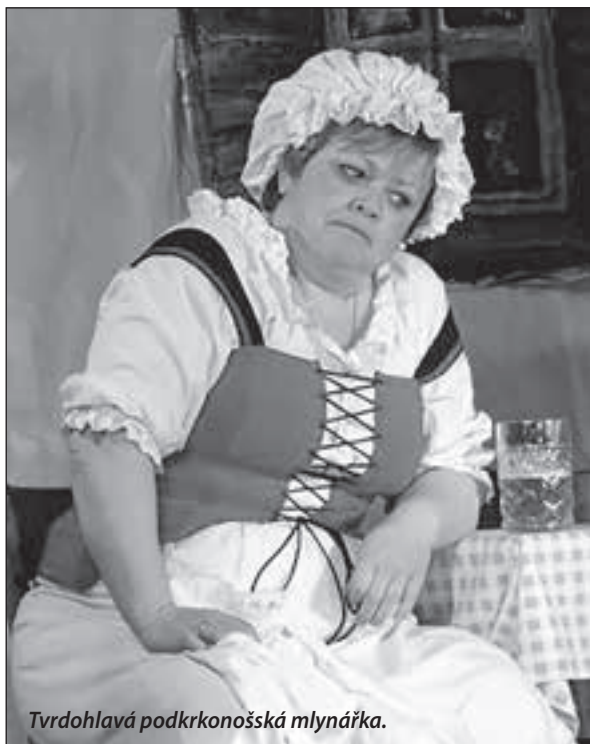
Tvrdohlavá podkrkonošská mlynářka.