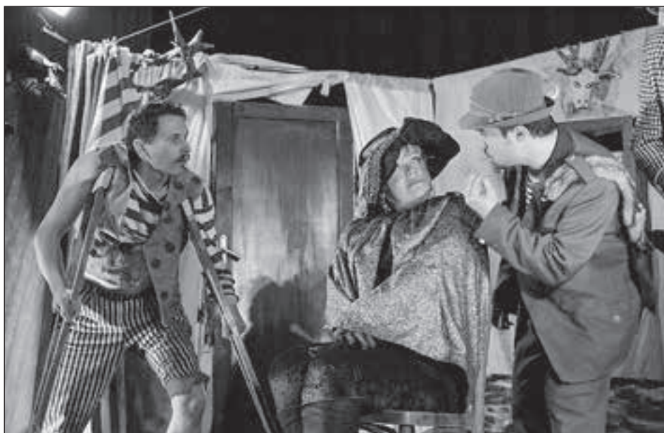
Hraběnka ve hře Hajný v lese usnul.

kde mají být a mají správné rekvizity. Hrály se Dalskabáty. Spousta čertů, hříšníci tančící v obrovských kotlích, falešný farář, kterého hrál opravdový farář, živý pekelný pes, no byla to mela na scéně i v zákulisí.