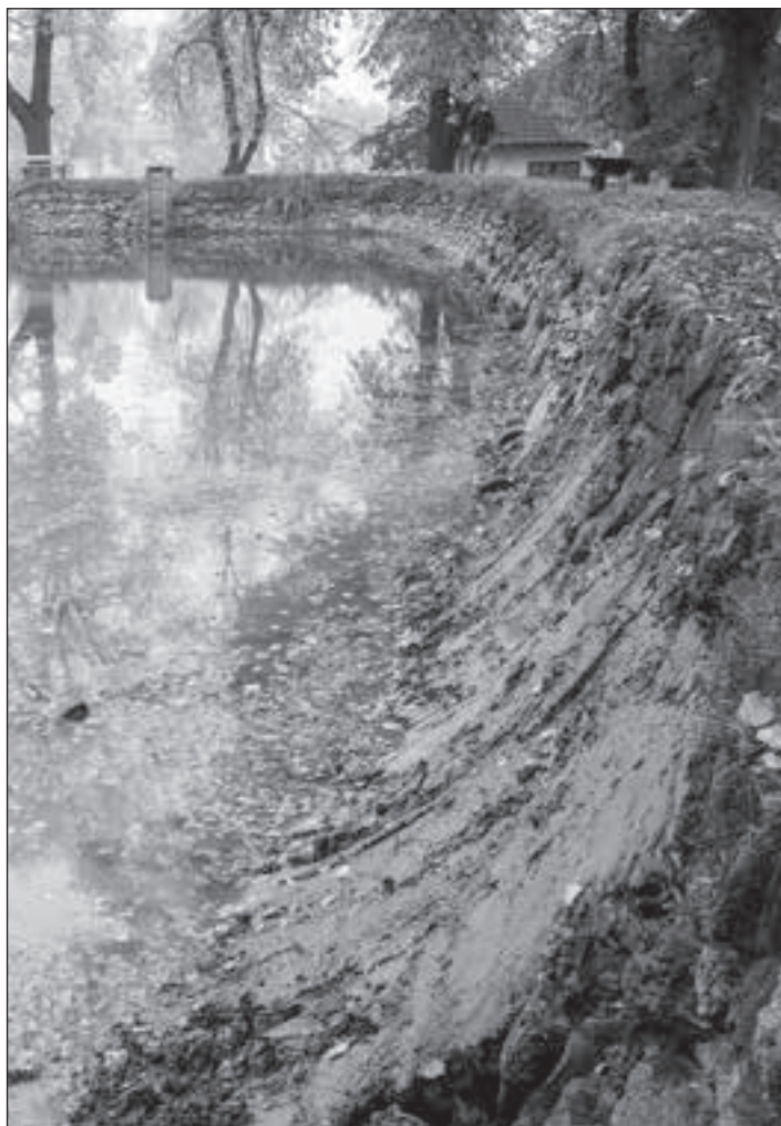
Opravená a zacelená hráz našeho rybníka.