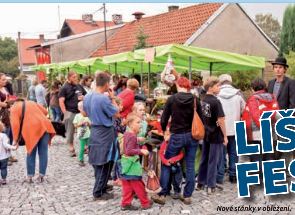
Nové stánky v obležení.

V rámci letošního již sedmého ročníku Líšnického festivalu slibovali organizátoři drobnou dramaturgickou změnu pod heslem „více hudby a méně decibelů“ (viz. Líšnický festival poštěsté, Líšnický zpravodaj – říjen 2015). Jak svému předsevzetí dostáli?