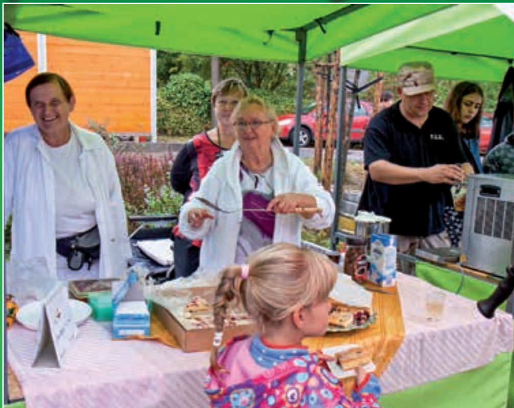
Líšnický festival: Naše oblíbené „padesátky“ opět nezklamaly, nejlíp prostě pečou babičky.