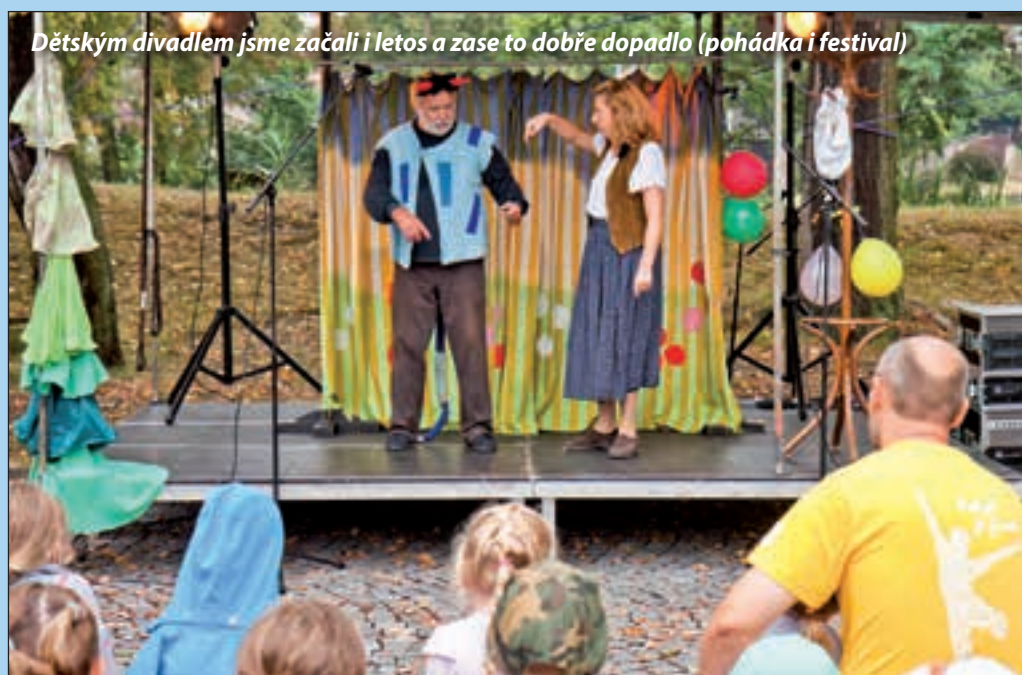
Dětským divadlem jsme začali i letos a zase to dobře dopadlo (pohádka i festival)